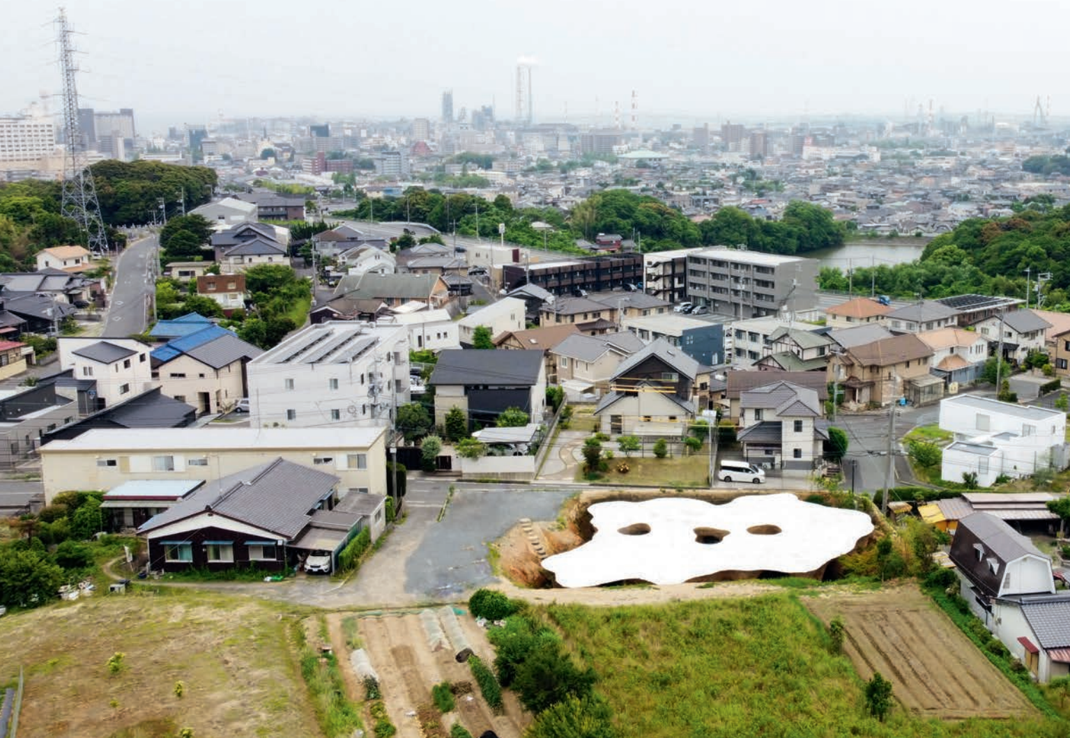
上图: Maison Owl 是一座兼具法国餐馆和私人住宅的建筑,建成后,餐厅独特的结构以及与周边社区的关系,让人眼前一亮,也启发人们对现代建筑的更多想象力。